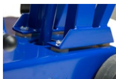
Odpružené uložení rukojeti