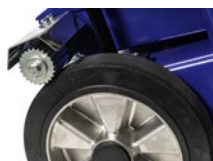
Elektrický pojezd s regulací rychlosti