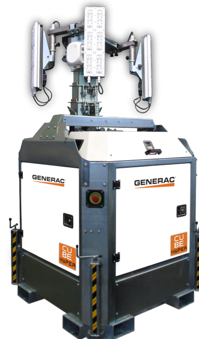
Skutečné provedení se může od obrázku lišit