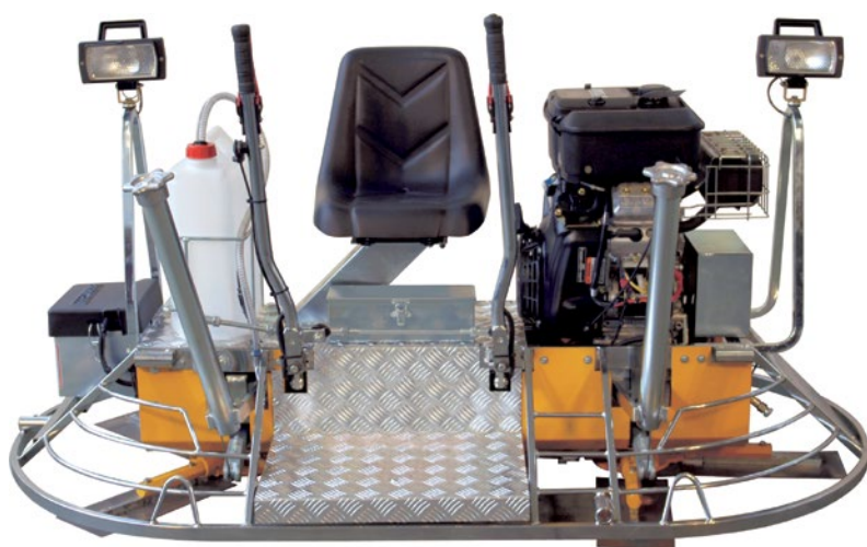
Hladička OL 90

Dvourotorové hladičky Barikell jsou určeny k bezvadnému uhlazení a ztuhnutí povrchů rozsáhlých betonových ploch v průmyslových halách, skladech, na parkovištích, letištních plochách, apod.