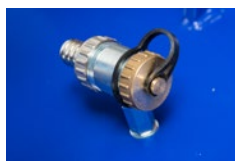
Vstup externí vody