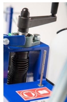
Spouštění kotouče do řezu a ukazatel