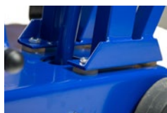
Odpružené uložení rukojeti