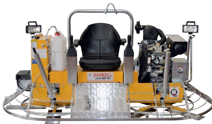
Hladička MK8-120 HCS